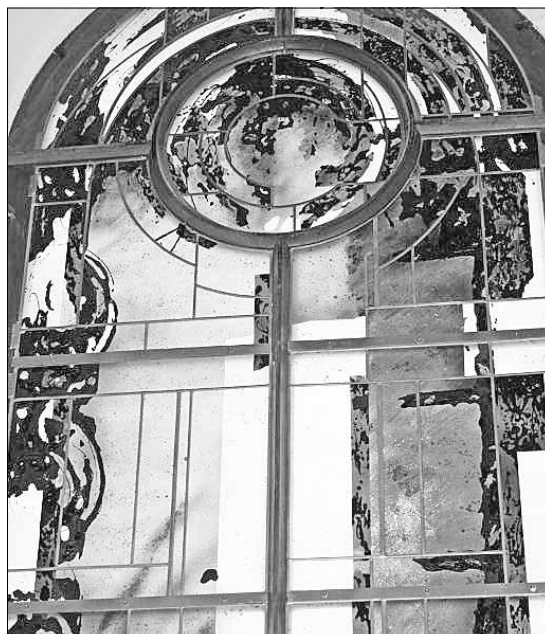
neu gestaltetes Südfenster